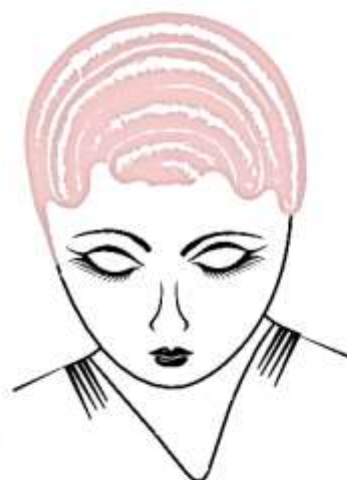
Рис. 8.6. Холодная укладка «поперечные волны»

При укладке, чтобы волосы не смещались, в отдельных местах их фиксируют зажимами. При использовании зажимов необходимо следить за тем, чтобы после