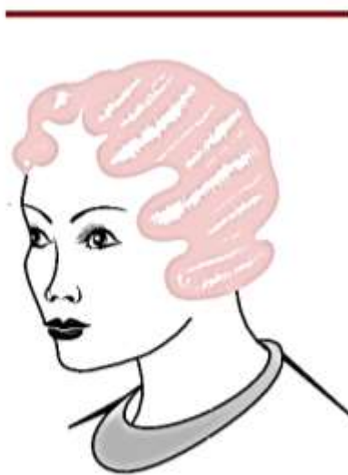
Рис. 8.4. Холодная укладка «прямые волны»

7. Волосы расчесывают от крона вниз и слегка к лицу. Средний палец располагают на волне и формируют крон с помощью указательного пальца. Получается вторая волна с большей стороны от пробора — выступающая.