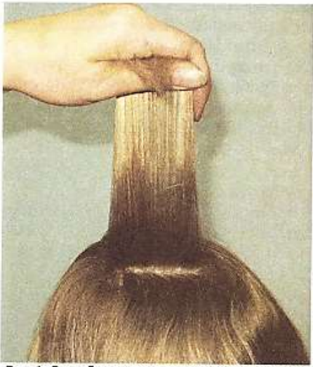
Рис. 1. Способ получения пряди при начесывании