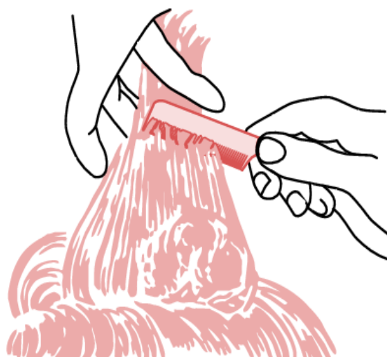
Рис. 8.3. Начес

Разновидность начеса — тупирование — получают легким взбиванием пряди с внутренней стороны.