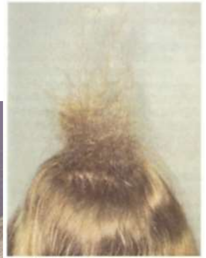
Рис. 2. Начесанная прядь