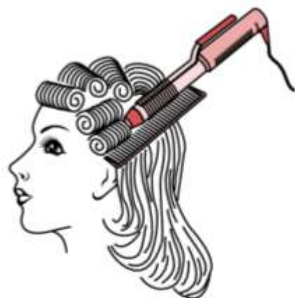
Рис. 8.7. Укладка волос с применением электрических щипцов

Укладка с применением электрических щипцов выполняется на чистых сухих волосах (рис. 8.7).