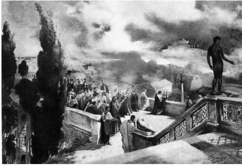
ЯН СТЫКА - "ПОЖАР РИМА"