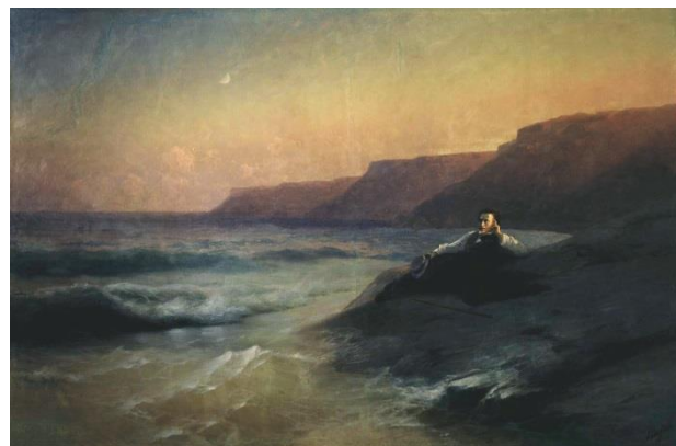
Пушкин на берегу Черного моря. 1887 год.