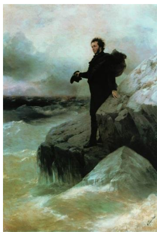
Прощание А. С. Пушкина с морем. 1877 год.

Сегодня будем говорить о море. На ум приходят строки А.С.Пушкина