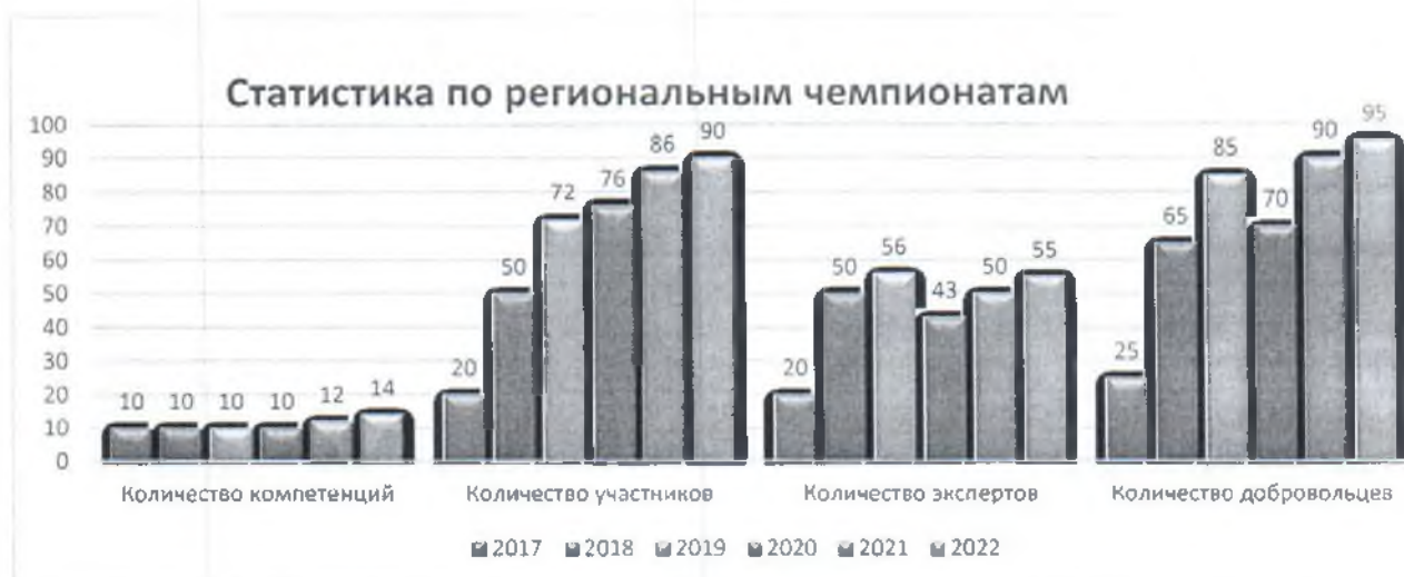
Рисунок 1 Название рисунка

Информацию об участии региона в Национальном чемпионате «Абилимпикс» и наличии призовых мест необходимо предоставить в форме таблицы по образцу: